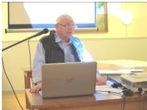
Formanden aflægger beretning!

(Ja undskyld, men den gamle "Politiskolemand" kom lige op i mig).