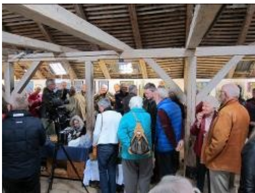
Foto fra sidste års fernisering.