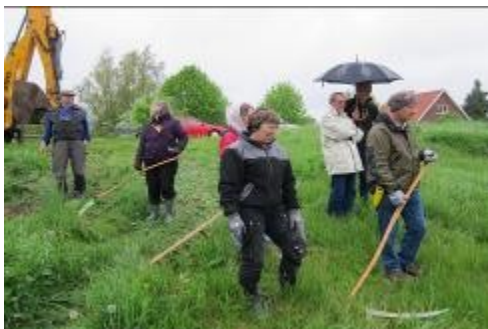
Undervisning i brugen af en le!